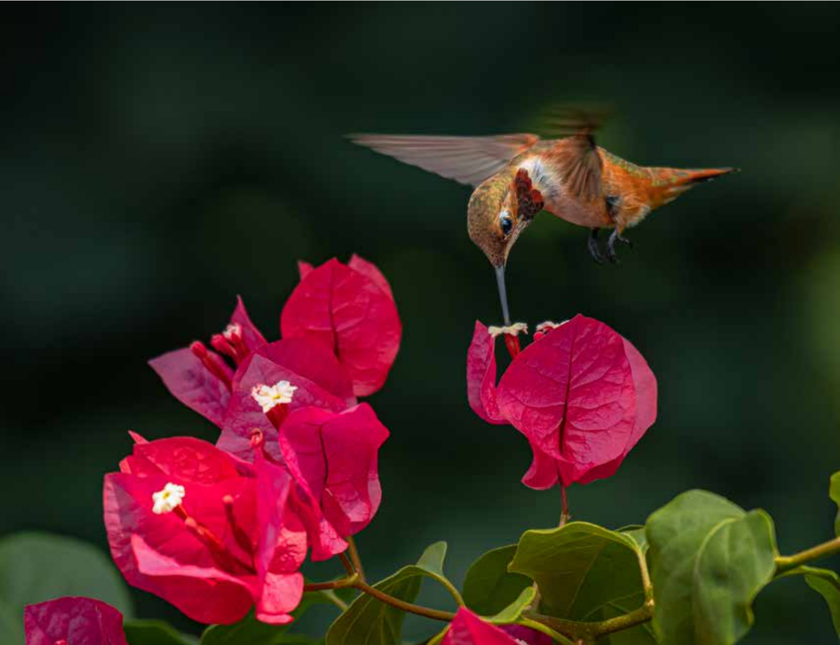
Autor: Daniel Pineda Vera . Nikon D7500 + Nikkor 200-500 mm f/5.6 | ISO 500, f/5.6, 1/800 seg.