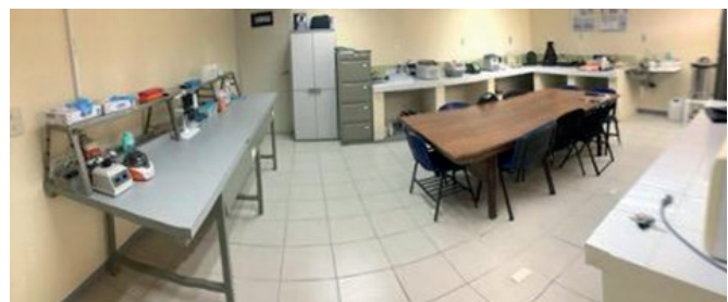
Figura 4.- Panorámica del laboratorio de ecología evolutiva