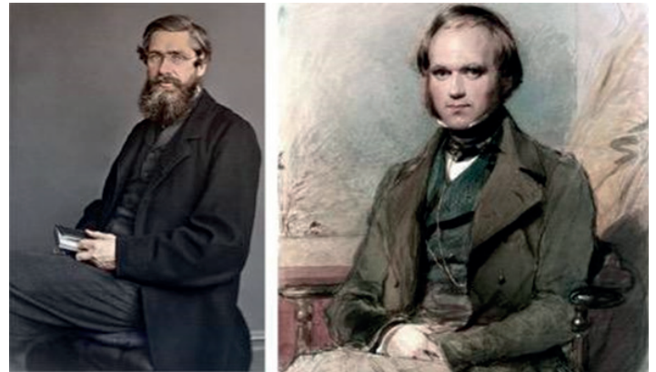
Figura 1. Alfred Russel Wallace (izquierda) y Charles Darwin (derecha). Fundadores de la ecología y la evolución.

Laboratorio de Ecología Evolutiva y Herbario Eizi Matuda, Instituto de Ciencias Biológicas, UNICACH.