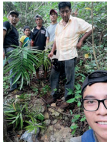
Figura 2. El trabajo de campo con alumnos que estudian las palmas.