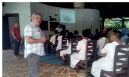
Figura 3. Taller sobre el funcionamiento de bosques y selvas y los servicios que proporcionan. Centro Ecoturístico "Santuario del Cocodrilo Tres Lagunas", comunidad lacandona de Lacanjá-Chansayab.