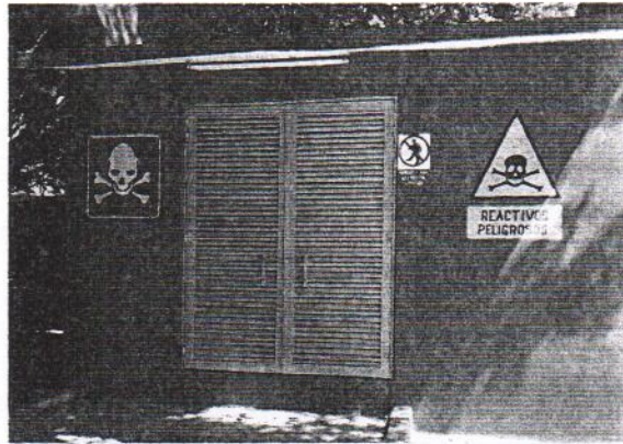
Figura 5. Almacén temporal de RPBI

En el ICBIOL se ha establecido un sitio de almacenamiento temporal (Figura 5) el cual se caracteriza por ser utilizado para almacenar temporalmente los RPBI, descritos en la NOM-087-SEMARNAT-SSA1-2002; y los RPs, descritos en la NOM-052-SEMARNAT-2005 y los dados de alta por el ICBIOL ante la SEMARNAT. El acceso a esta área sólo se permite al personal responsable de estas actividades.