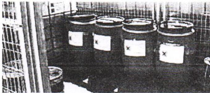
Figura 2. Contenedores para almacenamiento de RP

En el ICBIOL cada área y laboratorio debe contar con los contenedores y etiquetas específicas para la recolección e identificación de RP y RPBI generado (figura 2).