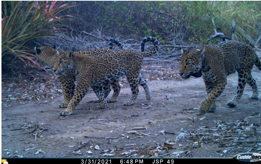
Figura 2. Jaguar hembra ( Panthera onca ) con sus dos crías, detectada por medio del “fototrampo” en Nayarit, México.

do sólo por los murciélagos. El mejor ejemplo de las técnicas directas no invasivas es el uso de las cámaras trampa que, contrario a lo que mencionamos anteriormente, no requieren la captura del individuo, pero permiten constatar su existencia por medio de fotos o videos.