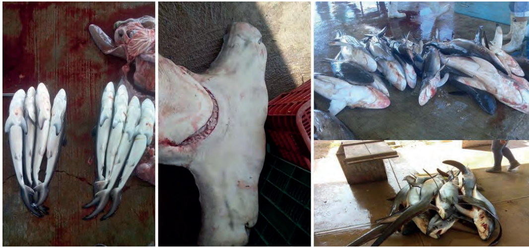
Figura 1. Especies de tiburones capturados en Paredón, Chiapas, México.

diferentes especies de tiburones, mojarra y lisa, además de otras especies de consumo local como bagre, jaiba, pargo y robalo [2].