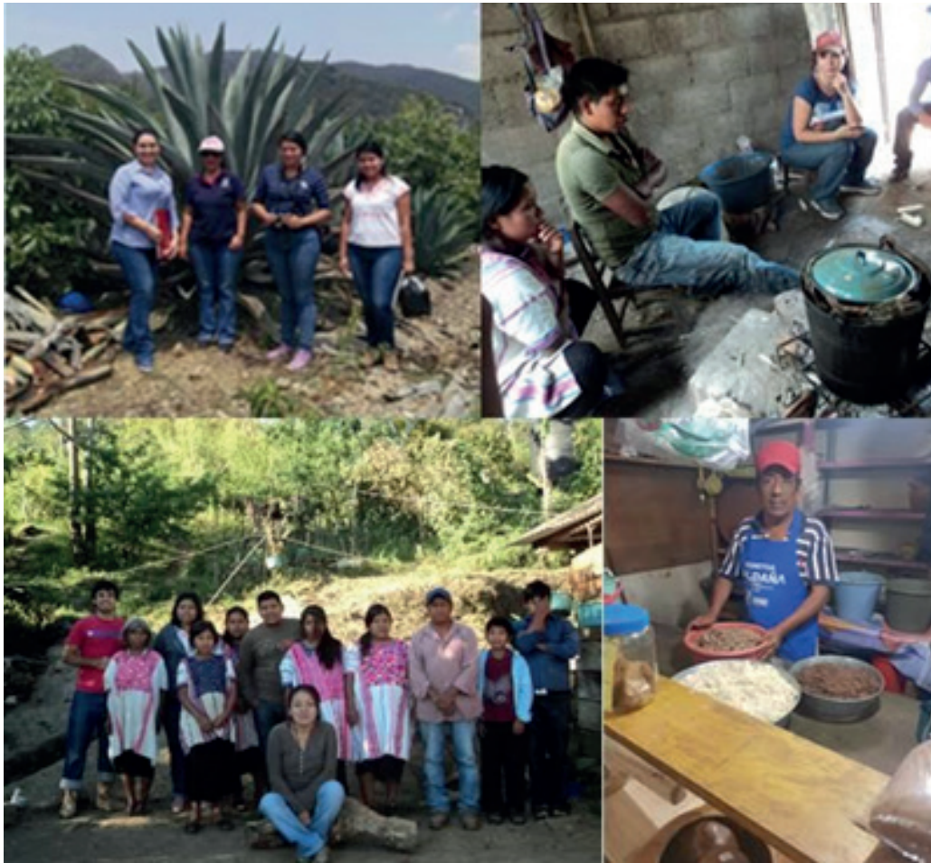
Figura 1. Acercamiento a las comunidades en las colectas en campo.