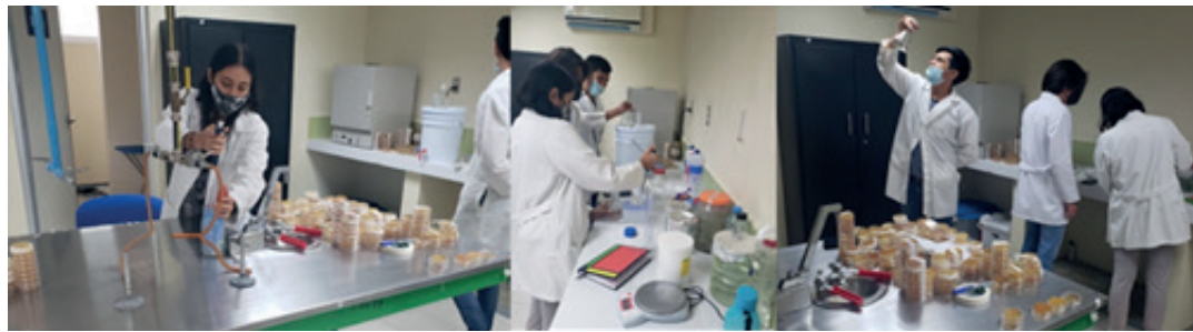
Figura 4. Procesamiento de muestras en el laboratorio.