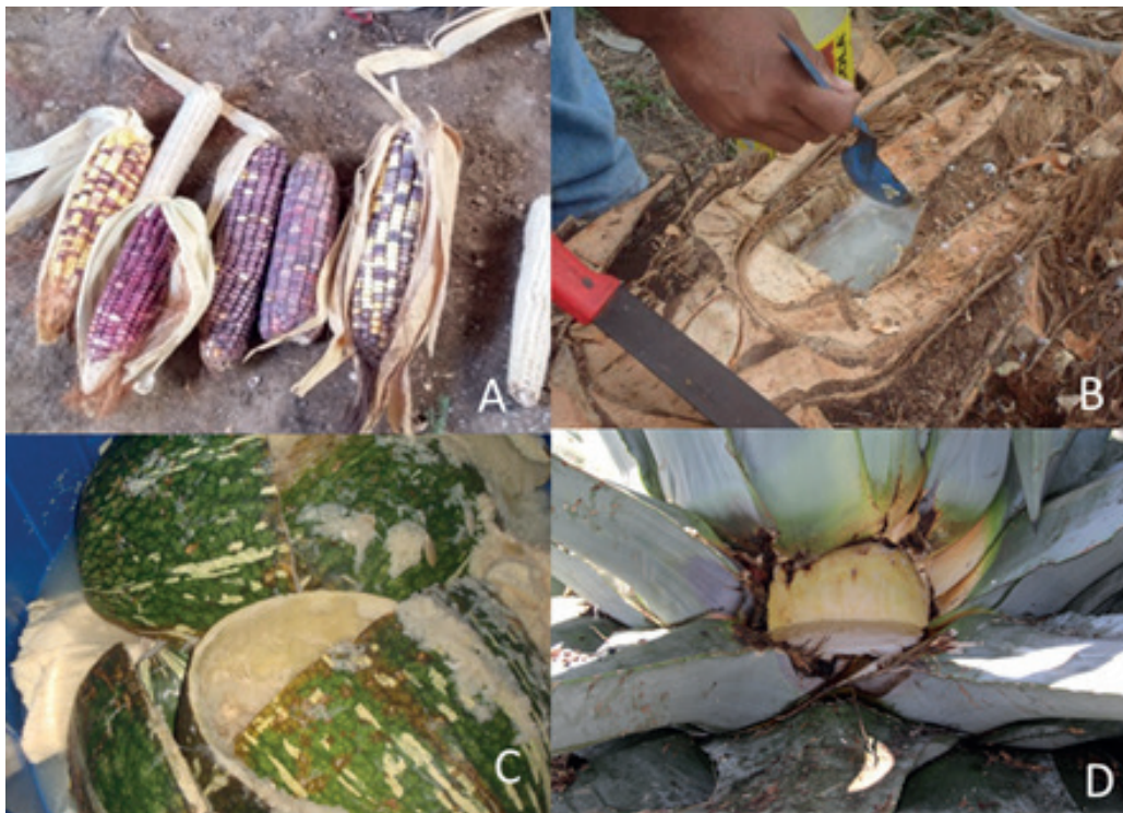
Figura 2. Materias primas de las que se han aislado microorganismos en el LIMic. A) Maíz ( Zea mays ) para elaborar atole agrio, B) Palma de coyol ( Acrocomia aculeata ) para taberna, C) Chilacayote ( Cucurbita ficifolia ) para producir chicha y D) Cajete de maguay ( Agave americana ) para elaboración de comiteco.